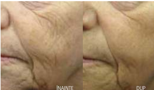
Laxitatea pielii, riduri 2 Tx cu e-matrix la o lună

Post-tratament pielea devine roșie și apare o senzație ușoară de arsură ca în cazul expunerii îndelungate la soare care dispare în 1-2 ore după tratament. Roșea și edemul pielii dispar în 2-3 zile cu o îngrijire simplă a pielii pe durata acestei perioade. Post-tratament se recomandă evitarea expunerii voluntare la soare iar în caz de expunere - protecție solară cu SPF mai mare de 30 timp de 2 luni. E-matrix prin timpul de recuperare scurt a cucerit pacientele care apelează la tratamente de textură prin rezultatele care le are cu timpul de recuperare scurt. În numărul viitor vom discuta despre aplicația Sublime - aplicația a dispozitivului E-two mai puțin cunoscut de pacienți și care este o tehnologie combinată de radiofrecvență bipolară și infraroșu (tehnologia elos) care are rezultate mai mult decât promițătoare pe zonele cu exces de piele mic și moderat realizând un efect de lifting nechirurgical.