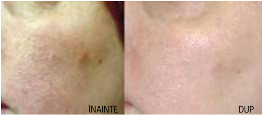
Pori dilatați tx2 cu e-matrix - RF fracționat

Pentru întinerirea pielii sunt necesare 2-3 tratamente la un interval de 3-4 săptămâni pentru a obține efectul dorit. Menținerea rezultatului se poate face prin sesiuni de întreținere la un interval de timp variabil în funcție de ritmul de îmbătrânire.