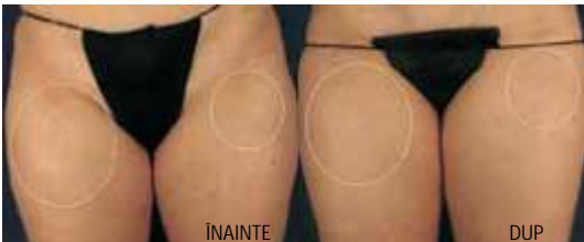
Vergeturi recente 4 tx e-matrix

În cazul vergeturilor și cicatricilor este nevoie de numărul de tratamente mai mare (în medie 6) însă se obțin îmbunătățiri relevante după aceste sesiuni de timp.