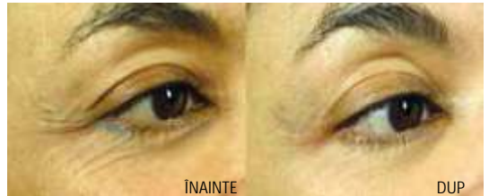
Riduri periorbitare 2 Tx E-matrix la o lună

În cazul vergeturilor și cicatricilor este nevoie de numărul de tratamente mai mare (în medie 6) însă se obțin îmbunătățiri relevante după aceste sesiuni de timp.