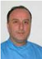
Doctor Q Medic specialist chirurgie estetică, plastică și reparatorie Q - Clinic - Cluj-Napoca

Soluția de Rejuvenare completă cu tratamentele e-matrix și sublimă