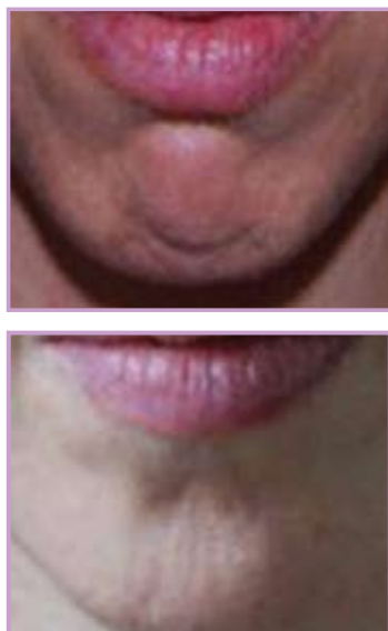
Fig. 4 - Remodelarea bărbiei cu botox prin relaxarea mușchiului mentalis hipereactiv cu toxină botulinică

Rezultate: tratamentul cu toxină botulinică este unul foarte popular în cabinetele de medicină estetică datorită faptului că este minim invaziv, fără perioadă de recuperare și cu rezultate foarte bune. În foarte multe clinici de medicină estetică este pilonul principal în întinerire, urmat la mare distanță de celelalte metode. Dacă există o indicație și o tehnică bune a medicului și așteptări realiste ale unui pacient bine informat, atunci acest tratament are un mare grad de satisfacție atât pentru pacient, cât și pentru medic, rezultate care se pot vedea în fotografiile din articol. (fig 2-5)