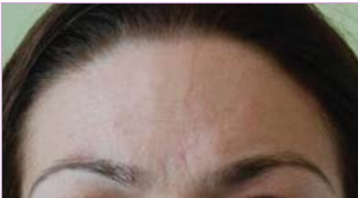
Fig. 2 – Regiunea frontală și glabulară înainte și după tratamentul cu toxină botulinică

Să nu uităm aplicațiile neurologice din sindroamele spastice, tratamentul migrenelor, al blefarospasmului, dar și al altor afecțiuni neurologice. Transpirația excesivă (axilară, palmară dar și în alte regiuni) poate fi tratată temporar cu toxină botulinică, acest tratament având un mare grad de satisfacție datorită faptului că