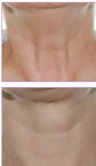
Fig. 5 – Fotografii înainte și după tratamentul ridurilor gâtului prin relaxarea mușchiului platisma cu toxina botulinică